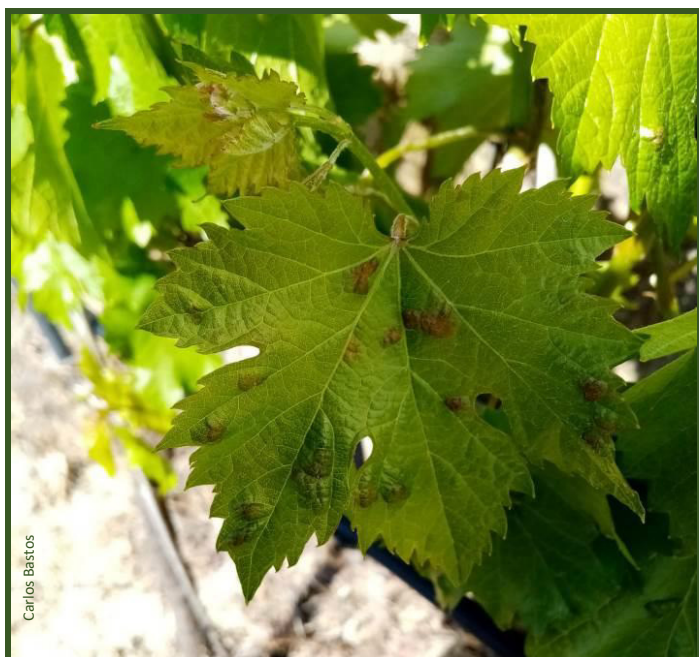
Sintomas precoces de erinose

Desaconselha-se a aplicação de acaricidas específicos.