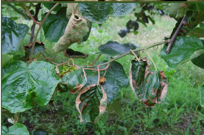
Ramos, gomos florais e folhas destruídos pela PSA