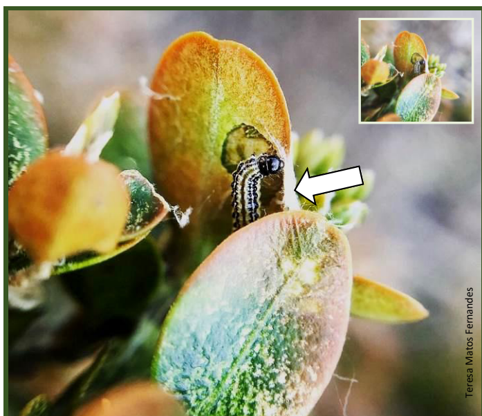
Larva do 2º estágio ou instar (1 a 2 cm). Imagem ampliada (em cima, imagem próximo do tamanho natural).

Ambos os produtos são autorizados no Modo de Produção Biológico e por isso, também indicados para aplicação, em melhores condições de segurança, em ornamentais nos espaços públicos e outros regularmente frequentados.