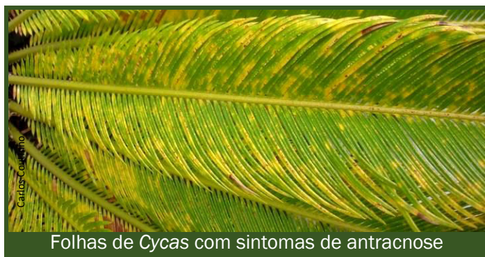
Folhas de Cycas com sintomas de antracnose

Não estão homologados fungicidas para o combate a esta doença. No entanto, os ensaios mostraram a eficácia da aplicação preventiva de fungicidas à base de cobre (hidróxido), procloraz , .