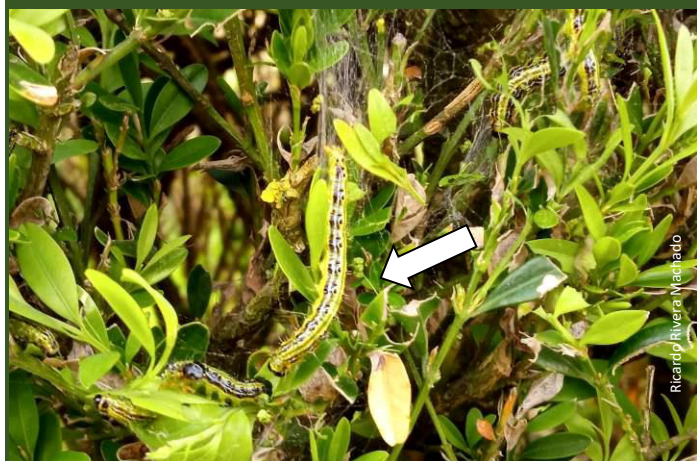
Larva do 5º estágio ou instar (4 a 5 cm). Imagem próximo do tamanho natural.