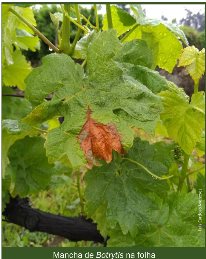
Mancha de Botrytis na folha

► Na plantação de vinhas novas, limitar o vigor da Vinha, escolhendo porta-enxertos, castas e até clones, que não confirmam excessivo vigor.