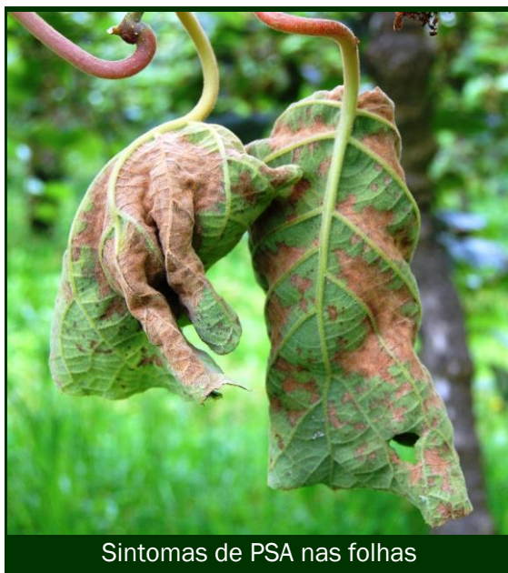
Sintomas de PSA nas folhas

⑨ Depois da descarga, todas as embalagens utilizadas devem ser limpas de terra, folhas e outros restos vegetais e lavadas com água sob pressão, antes de voltarem aos pomares. ( Os restos vegetais – ramos e folhas – são os principais meios de disseminação da PSA ).