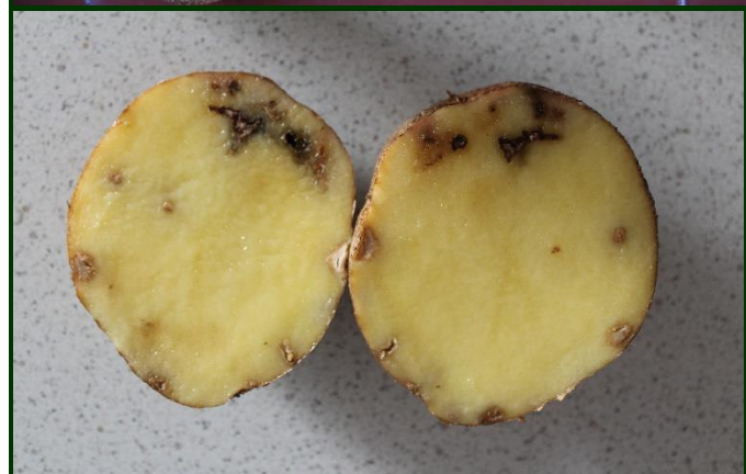
Sintomas de ataque de traça da batata