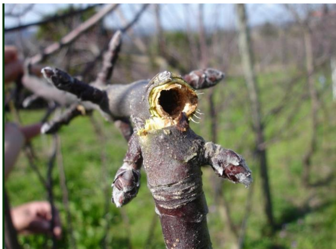
Tronco de jovem macieira mostrando a galeria aberta pela larva de zêuzera, que levou à sua quebra e perda da árvore.