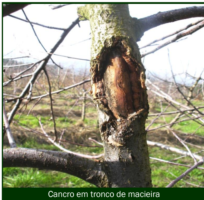
Cancro em tronco de macieira

Mais tarde, durante a poda, corte, retire do pomar e queime os ramos com feridas de cancro. As lenhas de poda com sintomas de cancro não devem ser aproveitadas para destroçar e incorporar no solo diretamente. Devem ser destroçadas e compostadas, antes da incorporação.