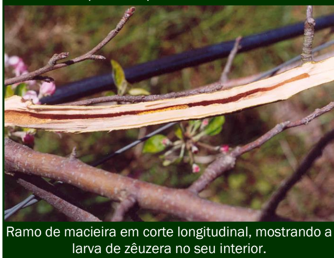
Ramo de macieira em corte longitudinal, mostrando a larva de zêuzera no seu interior.