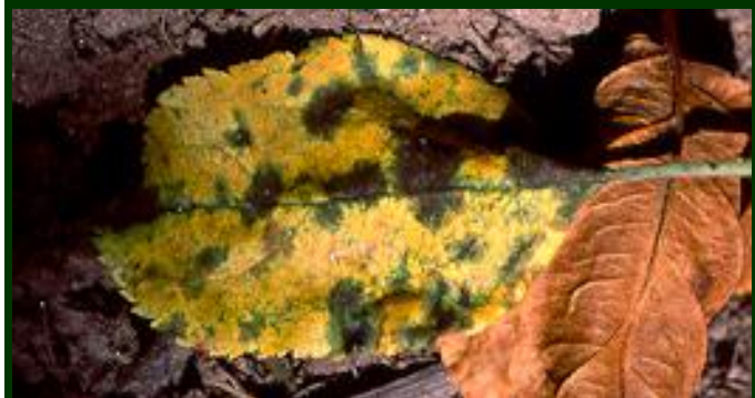
Folhas de macieira com sintomas de pedrado, caídas no solo, no outono

Outra técnica é destroçar as folhas caídas no solo, passando um destroçador de martelos. O destroçamento fino das folhas caídas pode reduzir em 80% o inóculo do pedrado na próxima primavera, facilitando o controlo da doença.